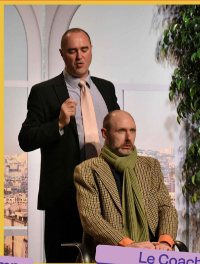
Le Coach Jeu 30/04 - 20h30