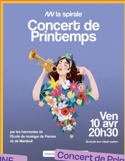
Concert de Printemps Ven 10/04 - 20h30