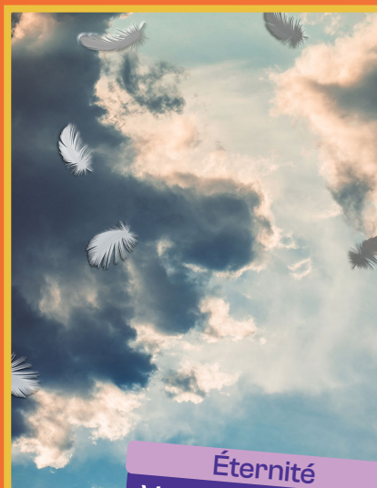
Éternité Ven 12/06 - 20h30 Sam 13/06 - 20h30