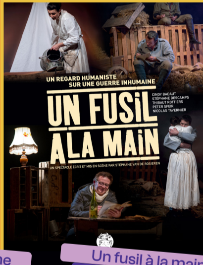
Un fusil à la main Ven 21/11 - 20h30