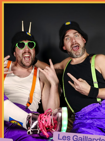
Les Gaillards d'en Face Sam 13/12 - 20h30