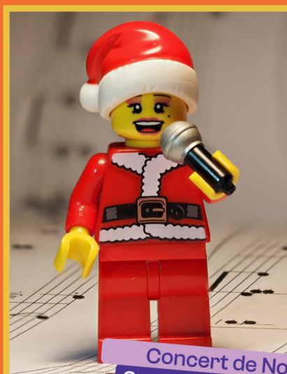
Concert de Noël Sam 06/12 - 20h30