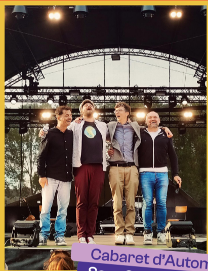
Cabaret d'Automne Sam 08/11 - 19h30

Plus d'informations sur nos réseaux sociaux ou par mail : apefismescentre@gmail.com