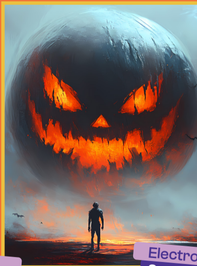
Electronic Halloween Sam 31/10 - 22h00