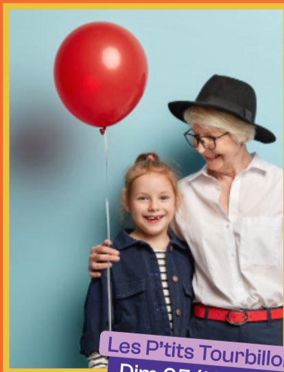
Les P'tits Tourbillons #1 Dim 05/10 - 14h00